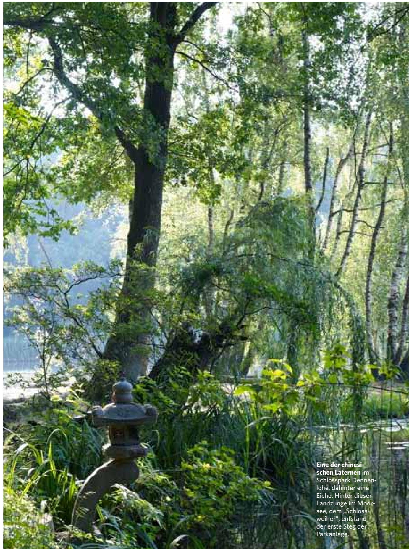
Eine der chinesischen Laternen im Schlosspark Dennenlohe, dahinter eine Eiche. Hinter dieser Landzunge im Moorsee, dem „Schlossweiher“, entstand der erste Steg der Parkanlage.