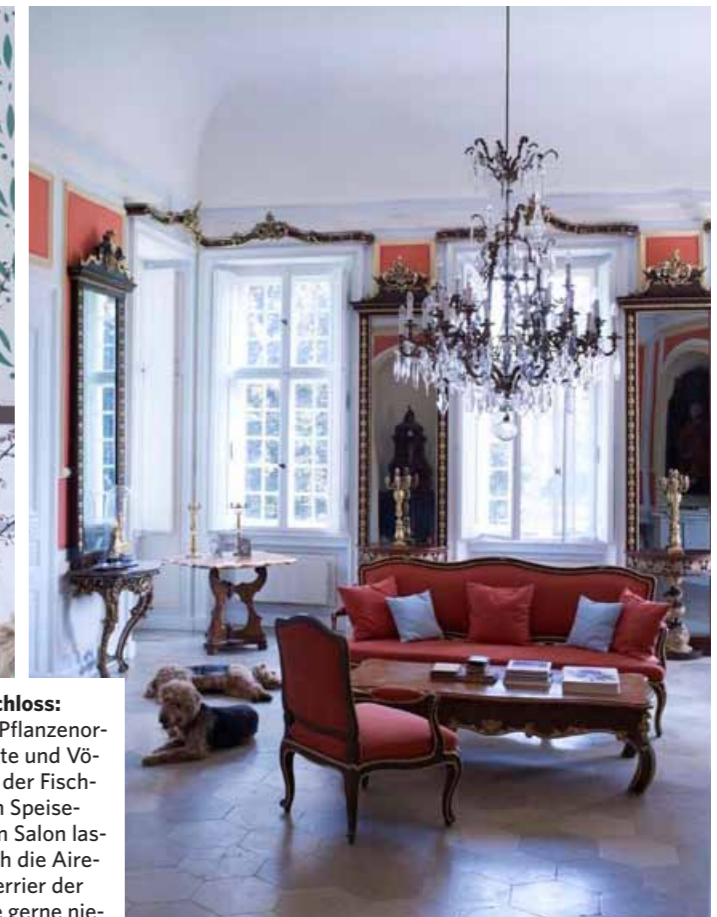
Landschloss: Oben: Pflanzenornamente und Vögel bei der Fischjagd im Speisesaal. Im Salon lassen sich die Airedale-Terrier der Familie gerne nieder. Unten: Sabine und Robert von Süsskind auf der Treppe zum Lustgarten. Die beiden schlichten Blätterborten wurden beim Bau 1734 entworfen.