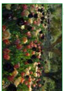
Tulip Dance, 2nd Place, EGPA 2013