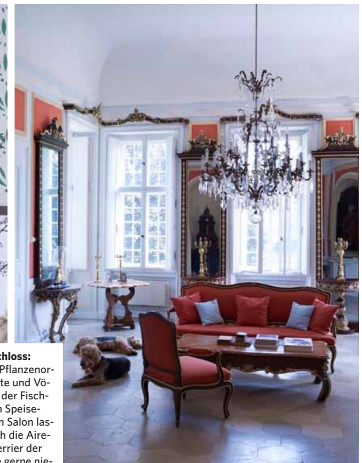
Landschloss: Oben: Pflanzenornamente und Vögel bei der Fischjagd im Speisesaal. Im Salon lassen sich die Airedale-Terrier der Familie gerne nieder. Unten: Sabine und Robert von Süsskind auf der Treppe zum Lustgarten. Die beiden schlichten Blätterborten wurden beim Bau 1734 entworfen.