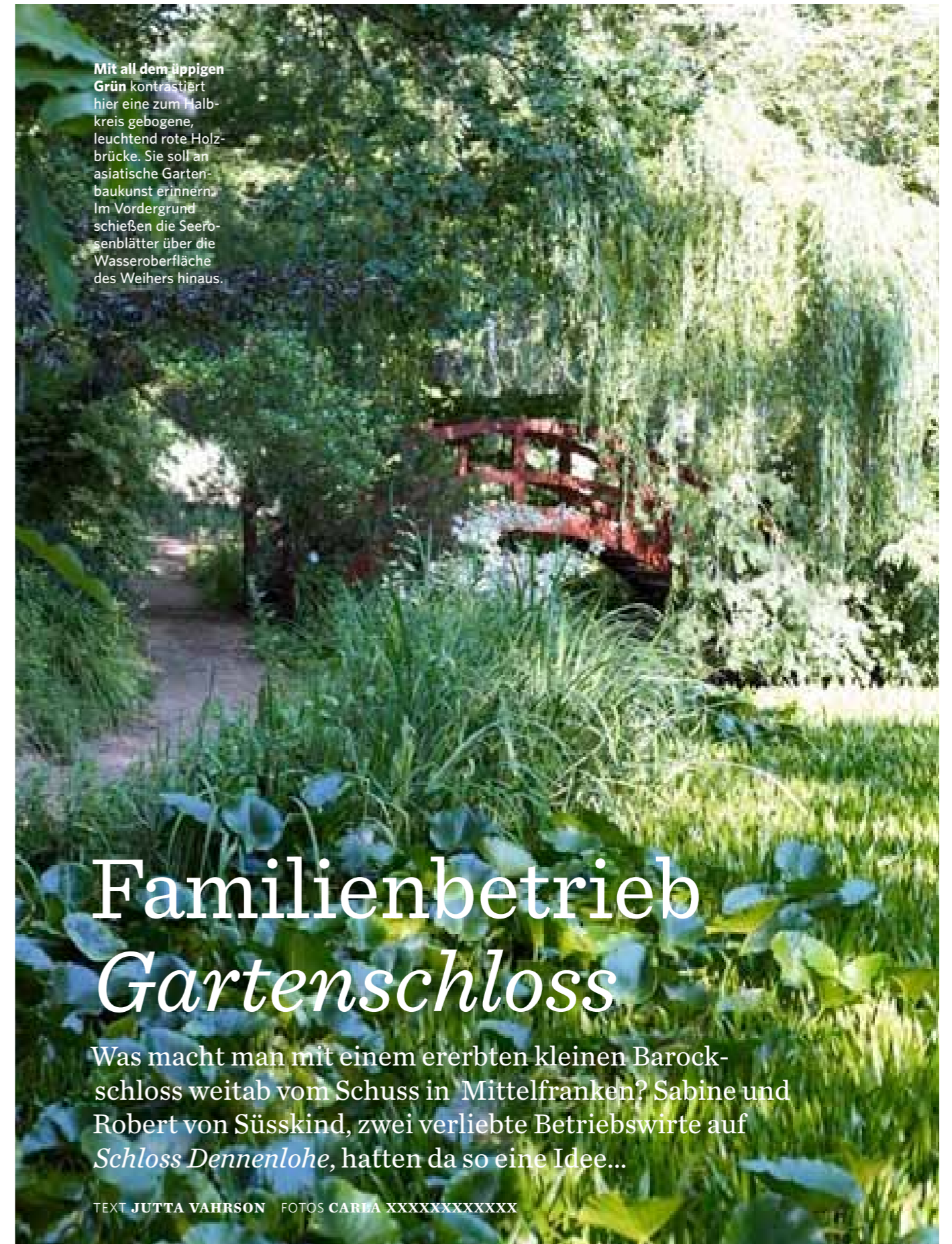
Mit all dem üppigen Grün kontrastiert hier eine zum Halbkreis gebogene, leuchtend rote Holzbrücke. Sie soll an asiatische Gartenbaukunst erinnern. Im Vordergrund schießen die Seeroseblätter über die Wasseroberfläche des Weihers hinaus.